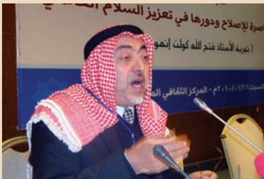
أ.د. محمد السرطاوي