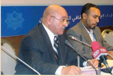
معالي الأستاذ فهد أبو العثم