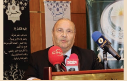
د. محمد راتب النابلسي