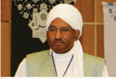
الإمام الصادق المهدي